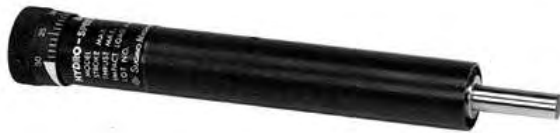
נוסת מהירות / הידרוצ'יק - מוחזר קפיץ Hydro speed regulator - Spring return type