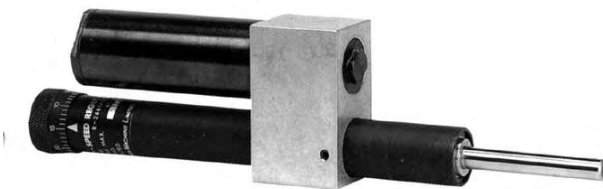
נוסת מהירות / הידרוצ'יק - מוחזר אוויר Hydro speed regulator - Air return type